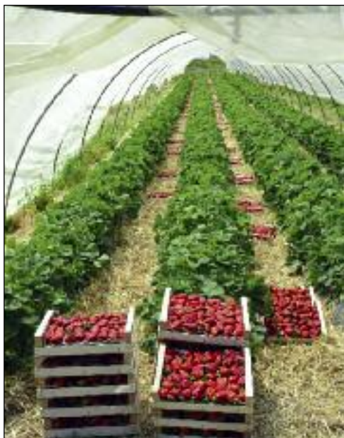
Senza l'Aiatta questa meraviglia non sarebbe possibile...

discreta somma, che però non potrebbe consentire al Consorzio ampi margini di manovra in caso di costi imprevisti (guasti, sostituzioni di contatori e tratti di tubatura, ecc.) e di assorbire senza problemi eventuali altri sbilanci causati da aumenti imprevisti legati all'energia elettrica. Oltre alle spese di manutenzione, guasti e riparazioni, più alte del previsto per i costi tutti lievitati, sono stati infatti proprio i costi dell'energia elettrica, aumentati del 77,19%, a “sballare” il bilancio 2022: all'E-nel sono stati infatti pagati € 77.086,60 (€ 1.850,50 in più di quanto incassato dalle bollette!). Il confronto con i due anni precedenti è impietoso: nel 2020 l'energia era costata € 21.547,66, lievitati a € 37.899,89 l'anno dopo. Il balzo tra gli ultimi due esercizi è stato quindi enorme e non sopportabile a lungo. Di qui la necessità, avvertita e fatta propria all'unanimità dall'Assemblea, di aumentare le tariffe da 0,60 a 0,80 centesimi il mc. per poter ricostituire un “tesoretto” intorno ai 25.000/30.000 euro, senza il quale il Consorzio non potrebbe funzionare e garantire i