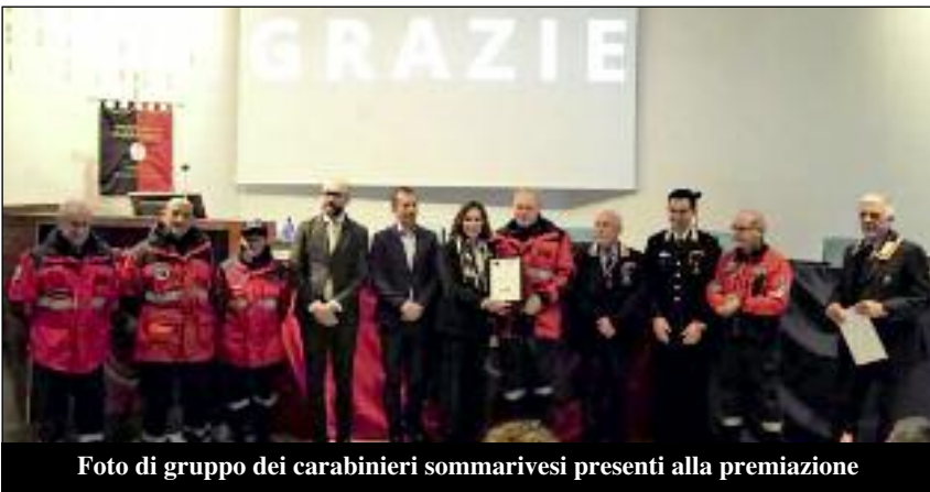
Foto di gruppo dei carabinieri sommarivesi presenti alla premiazione

Il 4 marzo presso il Salone Congressi della Provincia a Cuneo, nel corso della cerimonia per la consegna di diplomi di merito al volontariato, anche il GRUPPO DI VOLONTARIATO ANC di Sommariva Perno ha ricevuto l'attestato di riconoscimento (nella foto sotto) conferito dalla Regione Piemonte a testimonianza dell'opera e dell'impegno prestatosi nell'attività di contrasto alla pandemia negli anni 2020-2022.