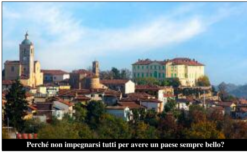
Perché non impegnarsi tutti per avere un paese sempre bello?