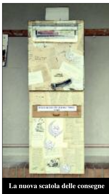
La nuova scatola delle consegne

Da qualche mese, poi, ogni lettore può prendere in prestito non due ma TRE volumi. Questo grazie alla possibilità di restituire il libro quando lo si è finito, anche fuori dagli orari di apertura della biblio-