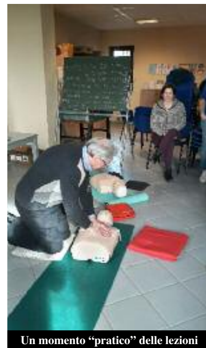
Un momento "pratico" delle lezioni