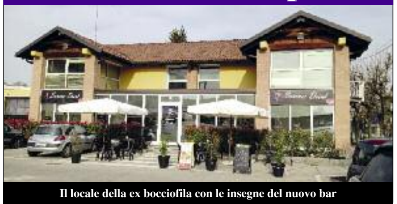
Il locale della ex bocciofila con le insegne del nuovo bar

Summer Drink: è il nome del nuovo esercizio inaugurato lo scorso 5 marzo nei locali della ex Bocciofila in piazza Torino. Offre servizi di bar, aperitivi, apericene in un ambiente accogliente e fresco, arricchito da uno spazioso déhor che consente momenti di relax e relazioni sociali. Auguri ai nuovi gestori da parte de Il Perno.