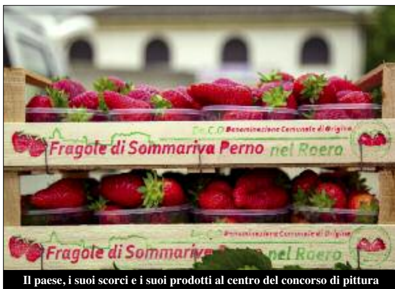
Il paese, i suoi scorci e i suoi prodotti al centro del concorso di pittura

I lavori devono essere finiti e consegnati entro le 17,00 per consentire alla giuria di scegliere i tre vincitori. Tutte le opere verranno poi esposte nella chiesa di San Bernardino per una grande mostra collettiva, aperta venerdì 26 e sabato 27 maggio dalle ore 17,00 alle 19,00 e domenica 28 maggio dalle ore 10,00 alle 12,30 e dalle 15,00 alle 18,00. Grande novità e curiosità: tutti i visitatori della mostra saranno invitati a votare