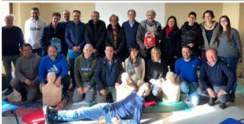
L'altro gruppo dei partecipanti al corso, sempre con insegnanti e organizzatori