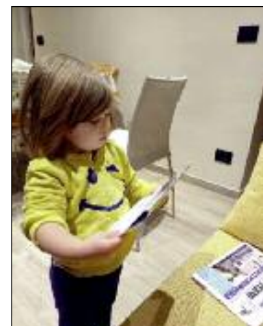
Piccoli lettori crescono...

data e collaudata, che riesce a distribuire Il Perno in modo capillare a tutte le famiglie del paese in tempi brevissimi. A tutti loro va naturalmente il grazie dell'Amministrazione e, crediamo, di tutti i sommarivesi che continuano a vedere ne Il Perno non solo uno strumento di informazione, ma una “finestra aperta” su un paese intero, la cui storia di oggi entrerà... nella storia.