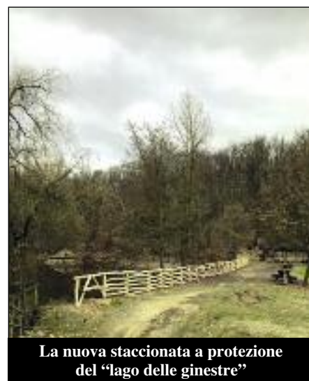
La nuova staccionata a protezione del “lago delle ginestre”