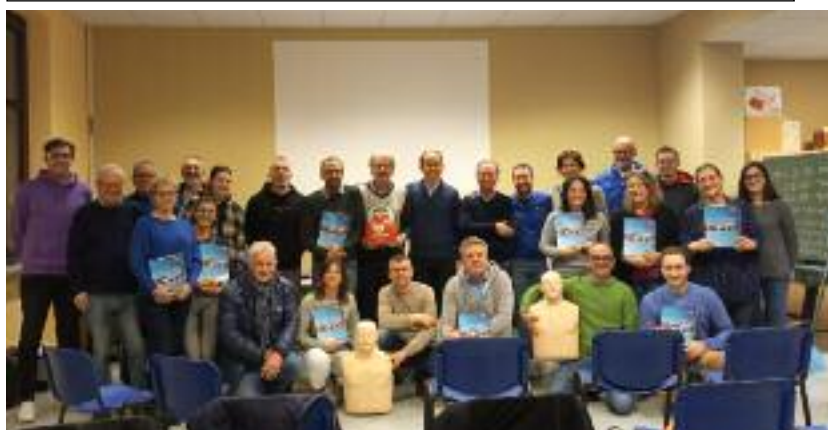
Il primo gruppo dei partecipanti alle lezioni sul defibrillatore

Visti il grande interesse e la numerosa partecipazione alla serata informativa, il Direttivo del Circolo Acli ha deciso poi di proporre un corso ufficiale e autorizzato dall'ASL, con il rilascio del patentino BLS-D Laici AHA. Le lezioni teorico-pratiche, tenute da tre medici coadiuvati da tre infermieri, si sono svolte nei locali dell'ex asilo lo scorso 4 febbraio e l'Acli ha contribuito al 50% delle spese (il resto a carico dei partecipanti). È stato un grande successo, con la partecipazione di 37 persone divise in due gruppi, a dimostrazione del grandissimo interesse che la materia ha sollevato. Risultato: un defibrillatore a disposizione a San Giuseppe e 37 persone capaci di usarlo. Ne valeva la pena.