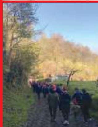
In Varodio, verso San Biagio