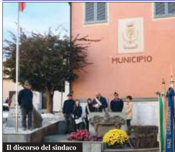
Il discorso del sindaco