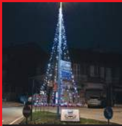
Magie di Natale in P.zza Roma