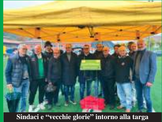
Sindaci e "vecchie glorie" intorno alla targa