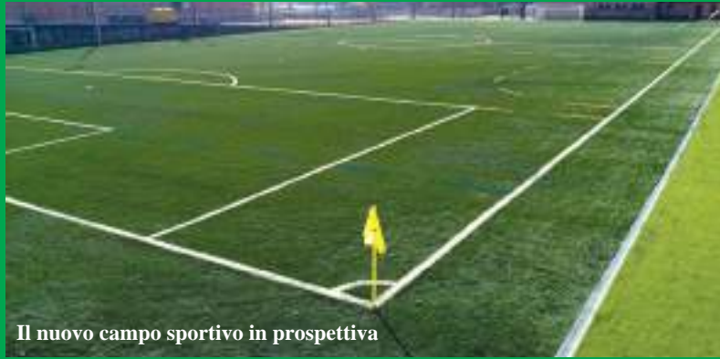
Il nuovo campo sportivo in prospettiva