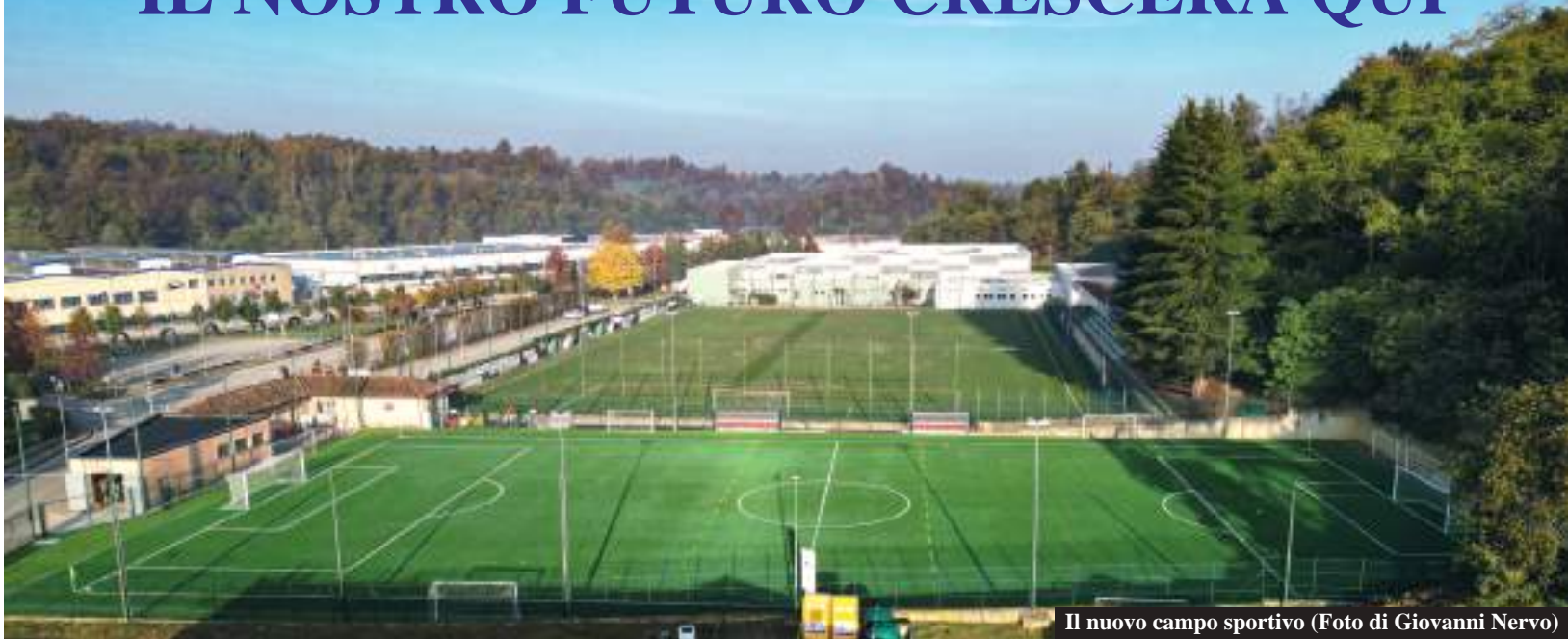
Il nuovo campo sportivo

Quella del 26 ottobre è stata una giornata che resterà a lungo nei cuori di tutti noi, una giornata storica per la nostra comunità e per la nostra società sportiva, che finalmente può contare su un impianto moderno e funzionale dopo anni di sacrifici su un campo in terra. Grazie a questo importante traguardo, i nostri 250 tesserati – di cui ben 170 sono ragazzi sotto i 18 anni – potranno allenarsi e giocare su una superficie d'avanguardia, in condizioni ottimali. Un traguardo che corona anni di impegno e che rappresenta un grande passo avanti per il futuro del calcio a Sommariva Perno.