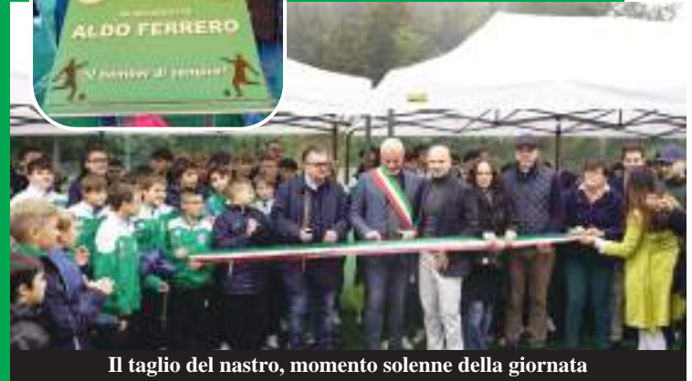
Il taglio del nastro, momento solenne della giornata