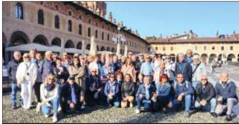
Il folto gruppo di partecipanti alla gita a Vigevano