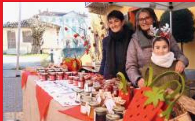
Il castello della Bela Rosin sembra vigilare sulla bella festa

concerti in piazza del Centro culturale. Quella di domenica 1 dicembre è stata una grande "festa di popolo" che ha coinvolto un mucchio di persone: volontari, cittadini singoli, istituzioni, associazioni, per una festa riuscita veramente. Quasi 50 i banchetti di vendita, con offerte di ogni tipo per accentrare le centinaia di persone accorse lungo il percorso. Colori, suoni, profumi che hanno riempito e scaldato non solo i corpi, ma anche e soprattutto i cuori. Corale è stata la risposta all'invito della Pro Loco, che, in collaborazione con il Comune, ha organizzato al meglio un evento, punto fermo ormai nelle offerte turistiche di Sommariva Perno. E' stato bello vedere decine di partecipanti alla "camminata di Natale" sul sentiero della Sommariva pre-romana e medievale, tante famiglie, decine di bambini sedersi increduli sul trono di Babbo Natale, tanti sommarivesi visitare la mostra di sette artisti "nostri". Complimenti indistintamente a chi ha organizzato, a chi ha partecipato, a chi ha vissuto fino in fondo un momento così intenso di festa. E... alla prossima edizione, che sarà ancora più bella!