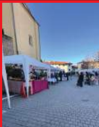
Scorcio di P.zza Montfrin