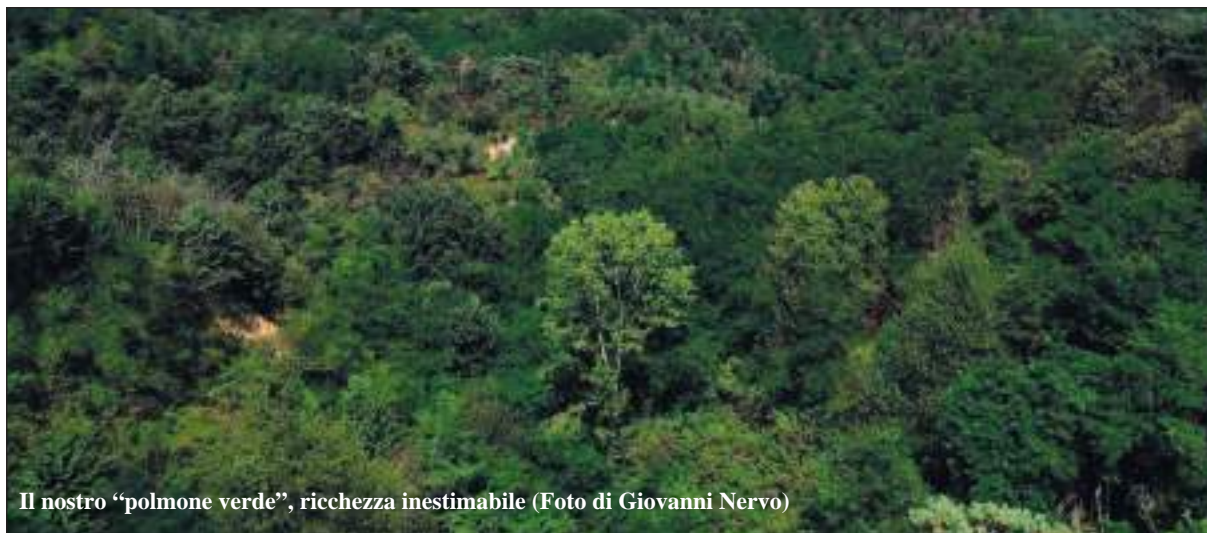
Il nostro "polmone verde", ricchezza inestimabile

Giornate d'ambiente e Il riccio e la farfalla - Seguite da Lorenza Bar, gratis per le scuole del Roero: passano ogni anno almeno la metà dei Comuni del Roero con scuole materne e alcuni comuni di Langa.