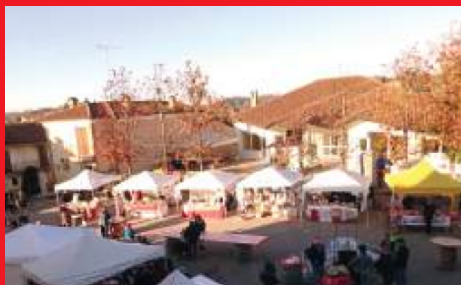
Veduta dall'alto dei banchetti in Piazza Montfrin