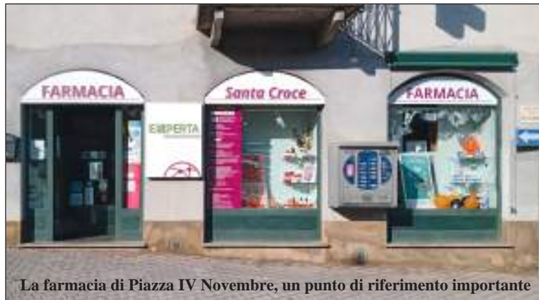
La farmacia di Piazza IV Novembre, un punto di riferimento importante

Durante la registrazione dei miei dati personali avevo lasciato natu-