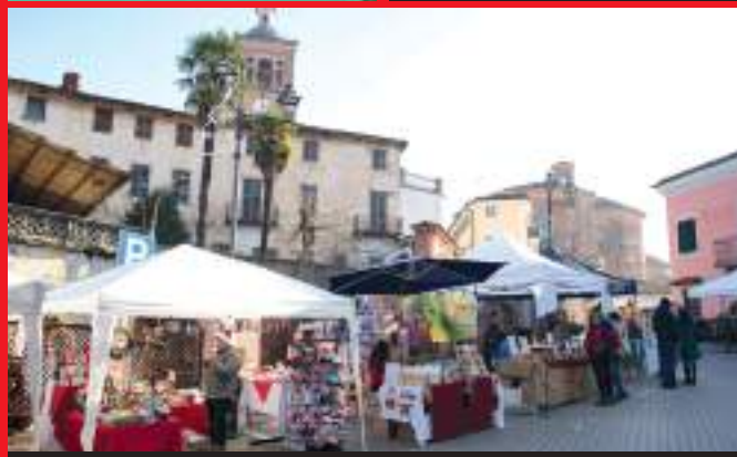
P.zza IV Novembre accoglie i visitatori