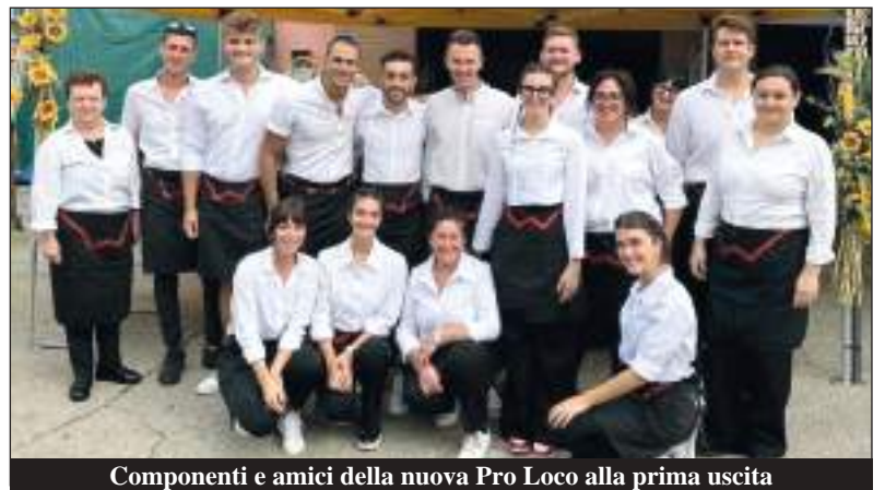
Componenti e amici della nuova Pro Loco alla prima uscita