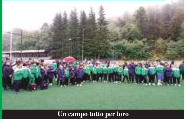
Un campo tutto per loro