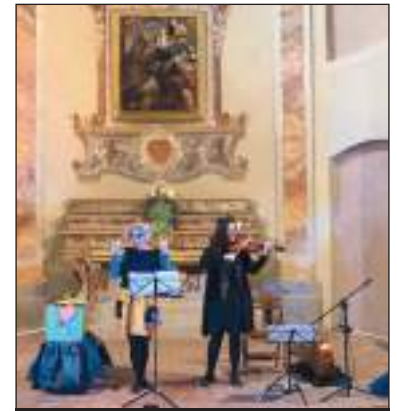
Il divertente Concert jouet