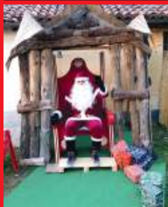
La meraviglia di tutti i bambini