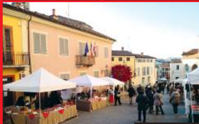
Piazza G. Marconi