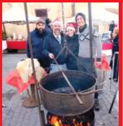
Una presidente felice