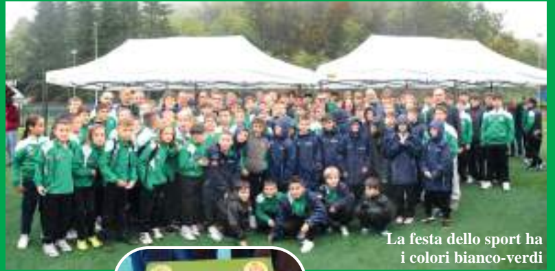
La festa dello sport ha i colori bianco-verdi