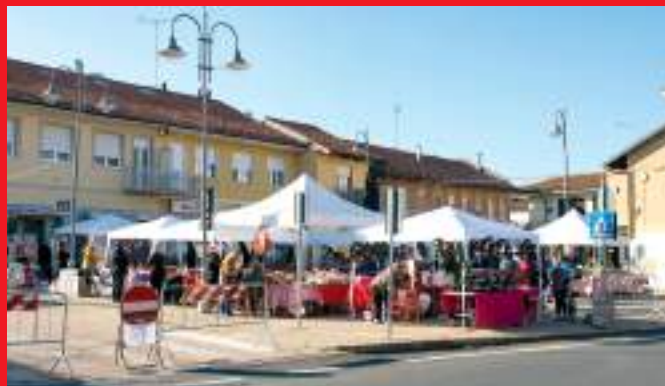
Piazza Roma, punto di incontro e di partenza per "i mercatini di Natale 2024"