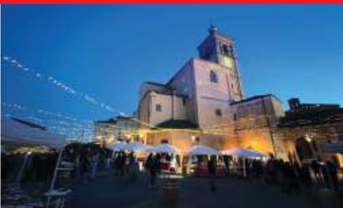
Suggerzioni del tramonto