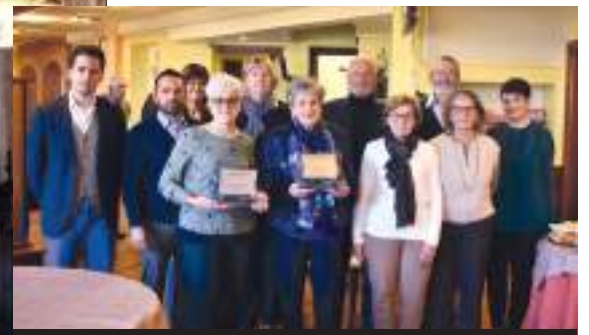
Le coltivatrici premiate, con i responsabili della Coldiretti sommarivese e le autorità

Domenica 10 novembre si è celebrata l'annuale "Festa del Ringraziamento", tradizionale appuntamento d'autunno per i coltivatori sommarivesi. Il primo momento solenne è stato vissuto in una chiesa parrocchiale al solito riempita dei profumi e colori dei tanti frutti della nostra terra, che danno sempre un tocco di gioia e di allegria. Don Gianni durante l'omelia ha voluto ancora una volta sottolineare il ruolo fondamentale che hanno gli agricoltori nella custodia di questo patrimonio unico ed irripetibile che sono la terra ed i suoi