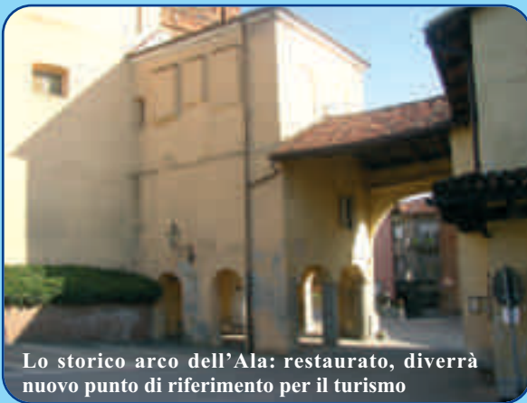
Lo storico arco dell'Ala: restaurato, diverrà nuovo punto di riferimento per il turismo

Questo progetto, di cui si parla in prima pagina, è nato con il desiderio di poter regalare al turista che verrà a visitarci un valore aggiunto di Sommariva