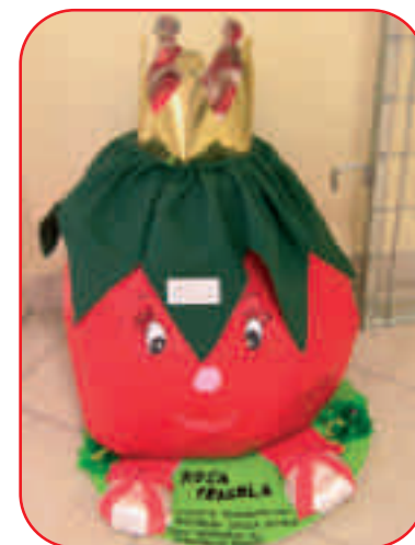
Un simpatico lavoro presentato lo scorso anno dalla scuola dell'infanzia