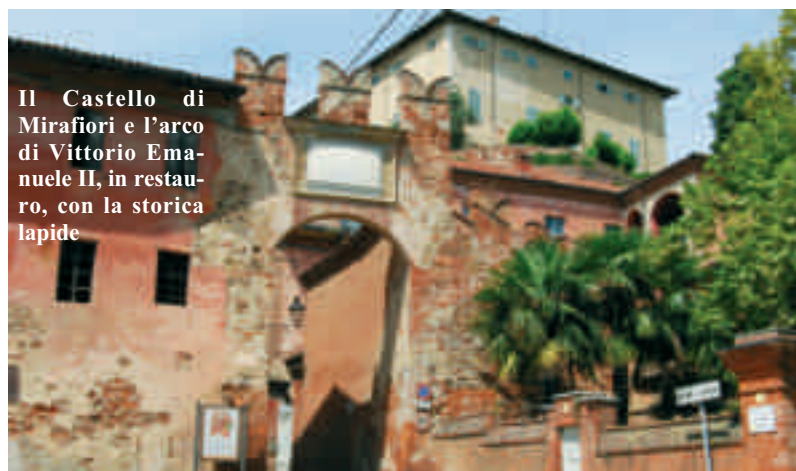
Il Castello di Miraffiori e l'arco di Vittorio Emanuele II, in restauro, con la storica lapide