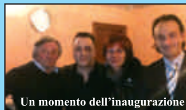
Un momento dell'inaugurazione

Il recapito della lavanderia in Via Vittorio Emanuele n. 7 ha chiuso i battenti all'inizio dell'anno. Ma per un esercizio che chiude, un altro si apre negli stessi locali, dove dal 27 febbraio è aperta l'agenzia Costa, che fornisce servizio di amministrazioni condominiali.