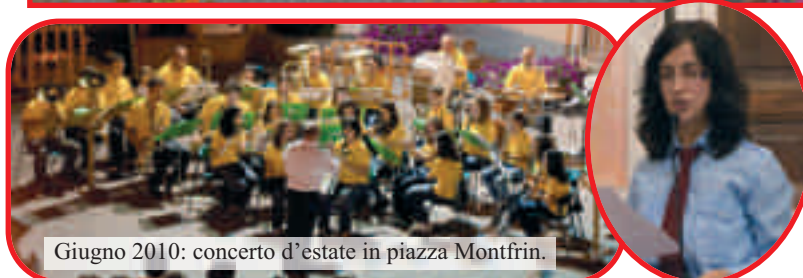
Giugno 2010: concerto d'estate in piazza Montfrin.