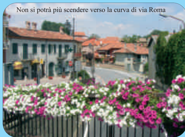
Non si potrà più scendere verso la curva di via Roma

Torino, ma "a richiesta" dei pedoni o automaticamente per auto e camion, permetterà uscite sicure da via Aie e dalla Life. L'operazione, se concessa dalla Provincia, sarà