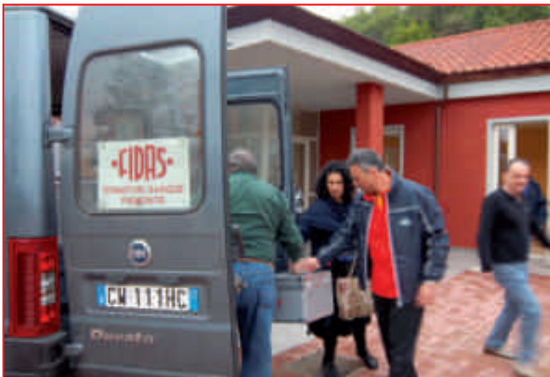
I primi prelievi nella "casa dei donatori". In alto, l'arrivo del mezzo della Fidas, con le attrezzature