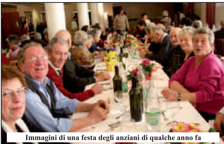
Immagini di una festa degli anziani di qualche anno fa