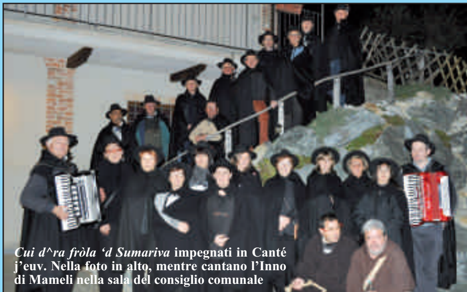
Cui d'ra fròla 'd Sumariva impegnati in Canté j'eu. Nella foto in alto, mentre cantano l'Inno di Mameli nella sala del consiglio comunale