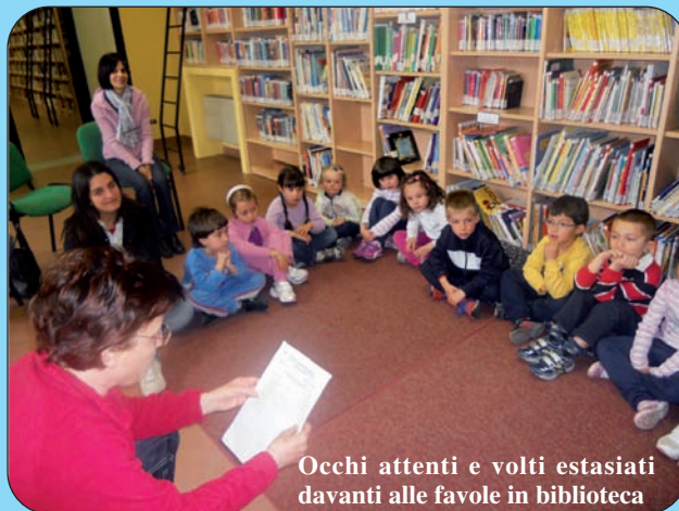
Occhi attenti e volti estasiati davanti alle favole in biblioteca

Sabato 26 maggio, nell'ambito dei festeggiamenti per la Sagra della fragola, il sindaco inviterà presso i locali della biblioteca comunale i genitori dei bambini nati lo scorso anno. Sarà un momento per presentare, insieme alle bibliotecarie, il patrimonio librario, in particolare quello adatto ai piccoli, disponibile presso la nostra biblioteca. Sarà anche un momento per parla-