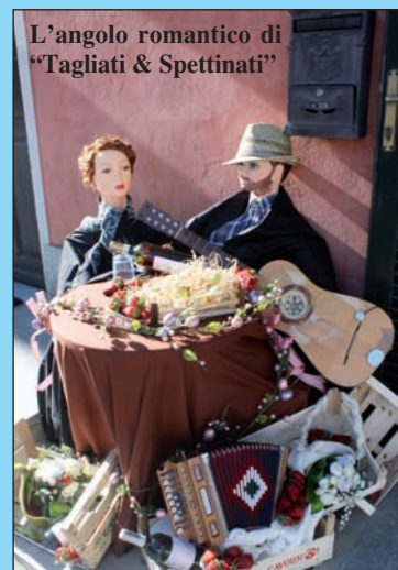
L'angolo romantico di "Tagliati & Spettinati"

Chi fosse interessato può trovare on line su www.brainTV.it tutta la manifestazione del Canté j'euv .