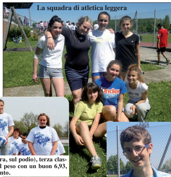
La squadra di atletica leggera