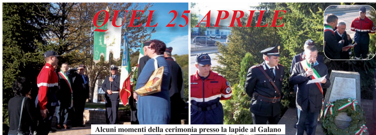
Alcuni momenti della cerimonia presso la lapide al Galano