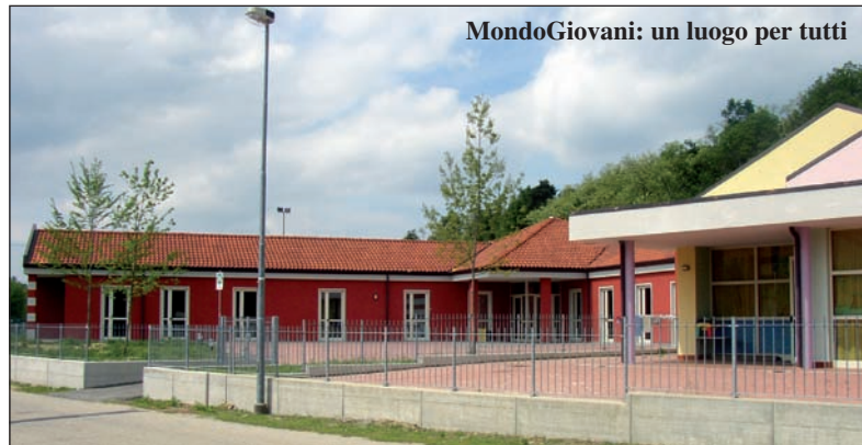
MondoGiovani: un luogo per tutti