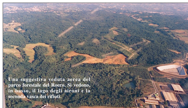
Una suggestiva veduta aerea del parco forestale del Roero. Si vedono, in basso, il lago degli aironi e la seconda vasca dei rifiuti.