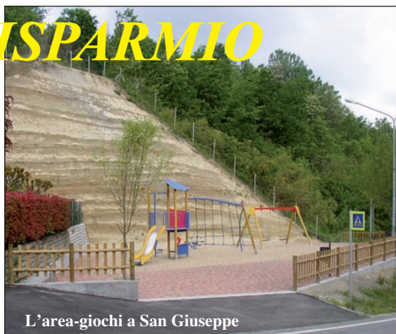
L'area-giochi a San Giuseppe