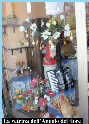
La vetrina dell'Angolo del fiore

Anche i commercianti sommarivesi hanno voluto dare il loro contributo in occasione della serata finale di Canté j'euv 2012 , organizzando un concorso vetrine dedicato all'evento, che ha coinvolto tutto il nostro paese.