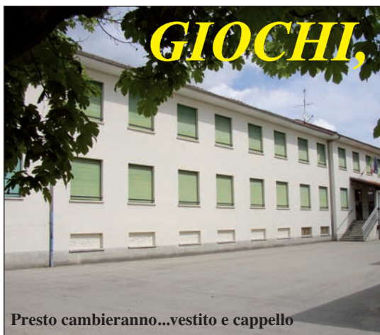
Presto cambieranno...vestito e cappello