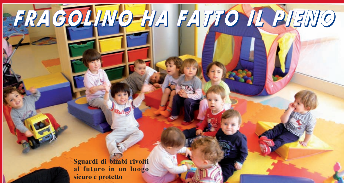
Sguardi di bimbi rivolti al futuro in un luogo sicuro e protetto